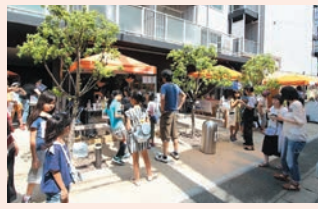
● 武蔵新城 新城WORK屋外スペース