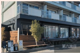
● 武蔵新城 第六南荘隣接地